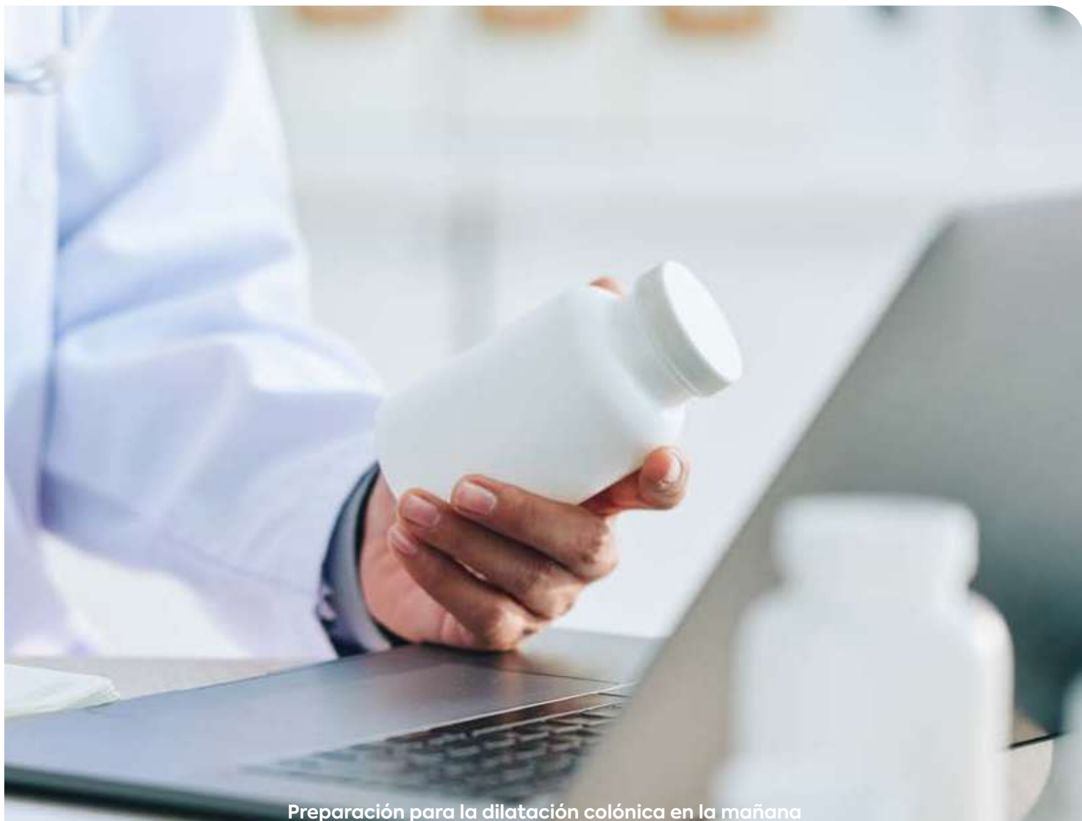
Preparación para la dilatación colónica en la mañana