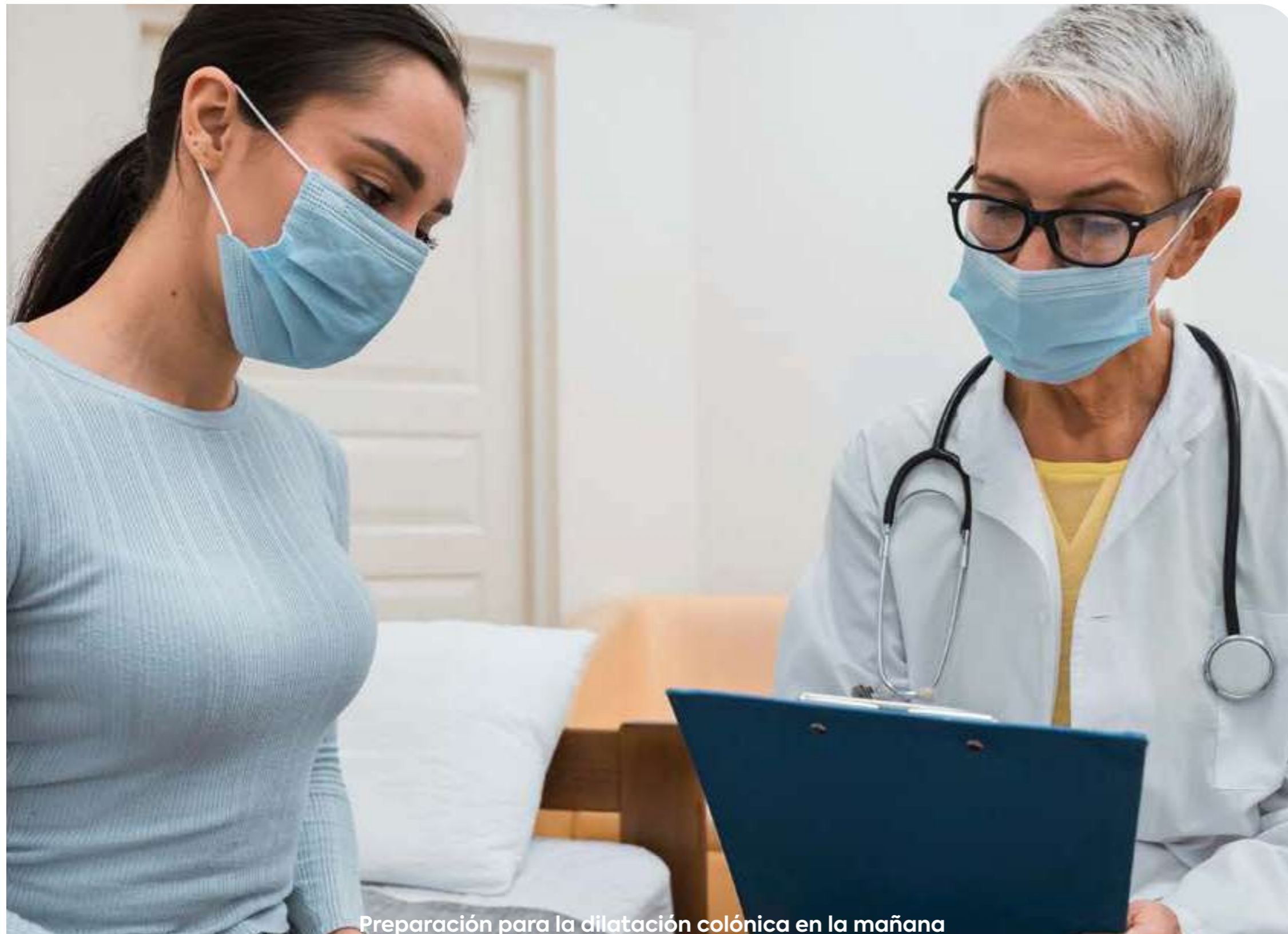
Preparación para la dilatación colónica en la mañana