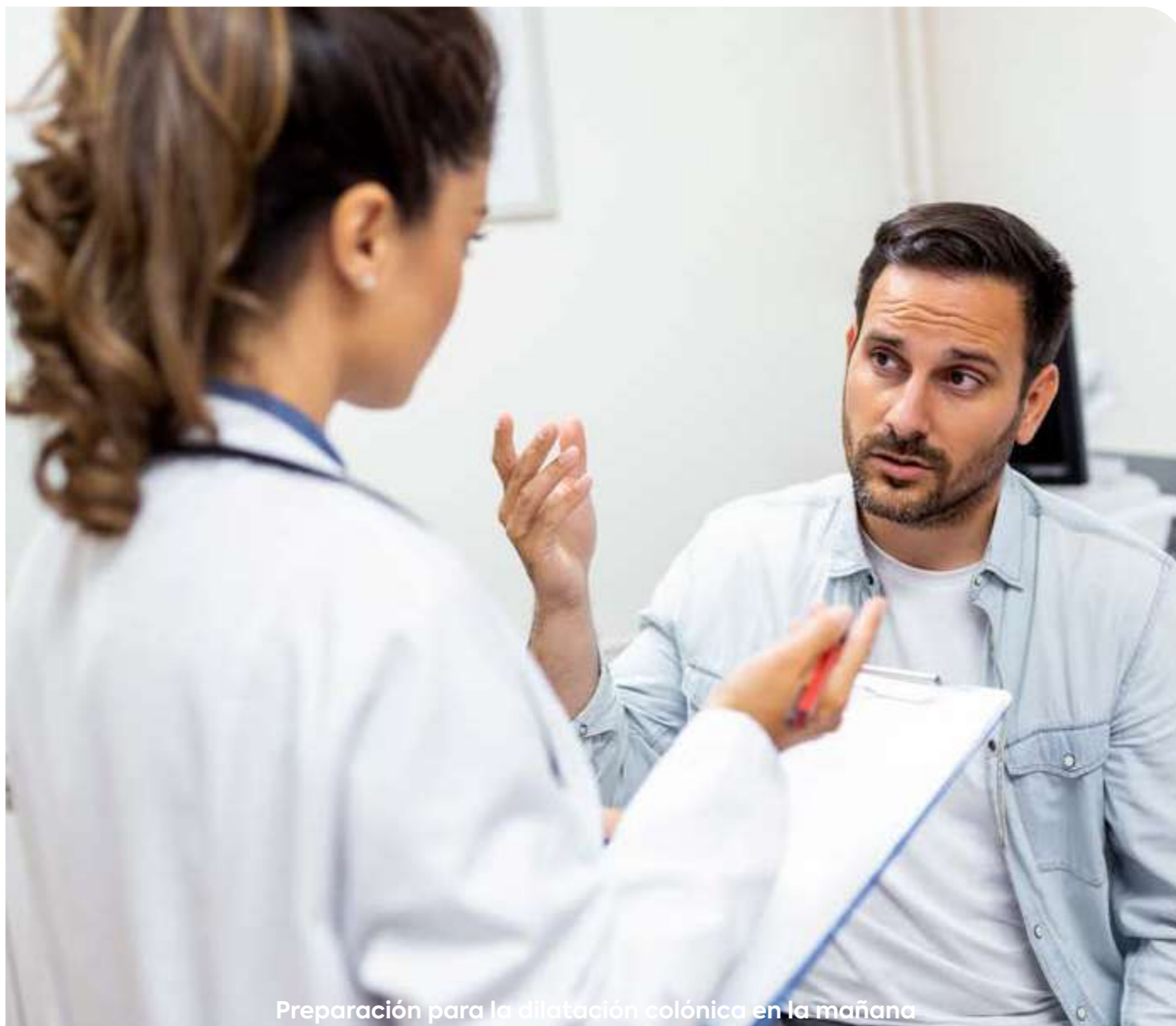
Preparación para la dilatación colónica en la mañana